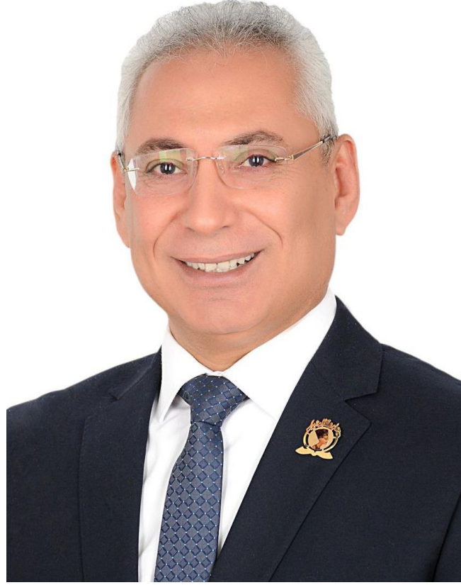
أ.د/ عصام الدين صادق فرحات رئيس جامعة المنيا