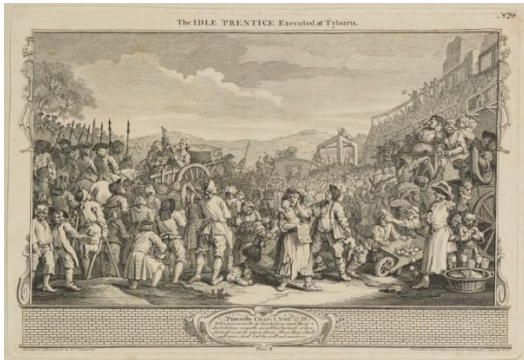
شكل رقم (ز)، وليم هوجارث William Hogarth، "1747م" - "The Idle Prentice Executed at Tyburn". المهني الكسول يعدم في تايبيرن " Tyburn " .