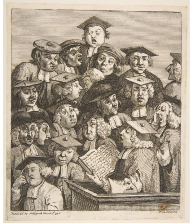
شكل رقم (1)، وليام هوجارث William Hogarth "1609 - 1676م" - علماء في محاضرة - Scholars at a Lecture، حفر حمضي بالإبرة و حفر خطي بالأزميل 'graveing and etching'، 18.6×22سم، متحف المتروبوليتان، مانهاتن، نيويورك.

فعلى مر القرون، كان هناك تصوير ساخر لمهنة الطب مع التزام المهنة بالقواعد الاجتماعية للأداب من أجل التقدم الشخصي، أو عرض المعرفة الزائفة تحت ستار التدريب المهني، أو السعي لتحقيق الربح في السوق. بغض النظر عن الموضوع، فإن التصوير الساخر لمهنة الطب يكرر اعتقاداً