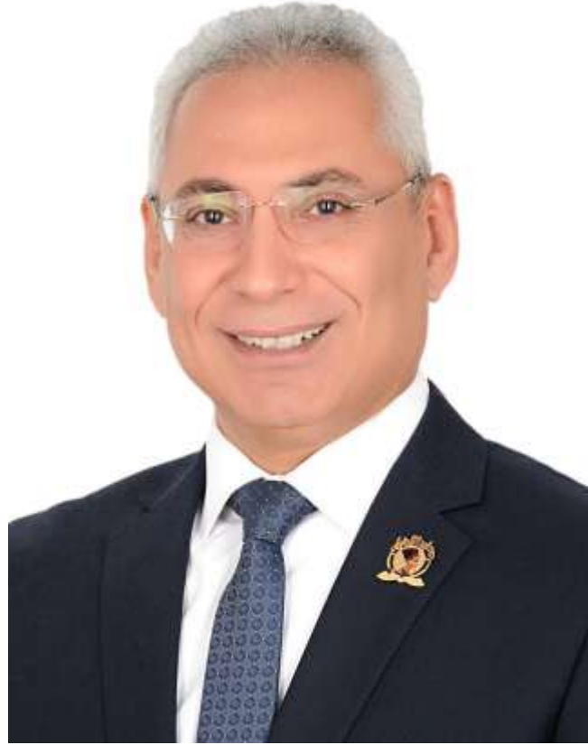
أ.د/ عصام الدين صادق فرحات رئيس جامعة المنيا