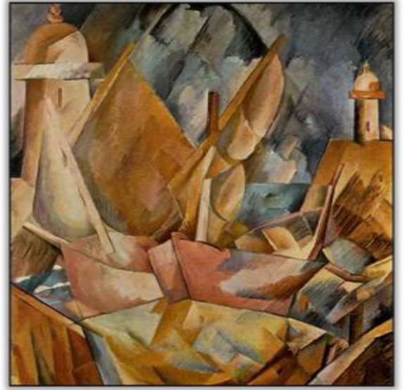
شكل (2) جورج براك، ميناء في نورماندي Harbor in Normandy، 1909م، معهد شيكاغو للفنون (Vegten، 2015م) .

أولاً التكعيبية السيزانيه (Cubism by Artist Cézanne) وهي المستمدة من اعمال الفنان بول سيزان (سعيد، 2016م) حيث تتمحور هذه المرحلة حول تفكيك العناصر الطبيعية الى اشكال هندسية بسيطة شكل (2) (أبو دبسة وغيث، 2012م)،