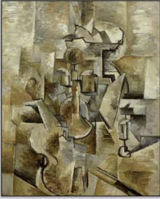
شكل (3) جورج براك، كمان وشمعدان Violin and Candlestick، 1910م، متحف سان فرانسيسكو للفن الحديث (Meleca، n.d).

ثالثاً التكعيبية التركيبية (Synthetic Cubism) وكان أهم ما يميز هذه المرحلة هو استخدام عناصر ملموسة في اللوحة مثل الأوراق الملصقة والصحف وأوراق الجدران وغيرها، وتوليفها ودمجها مع اللوحة التكعيبية ومن ثم طلائها بشكل تكعيبي هندسي وقد سمي هذا الأسلوب بالكولاج collage شكل (4) (Cramer & Grant، 2022م).