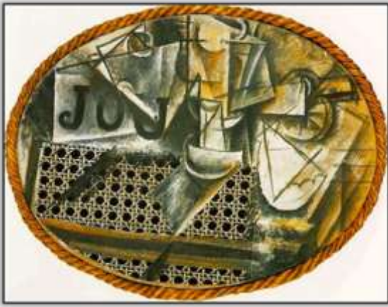
شكل (4) بابلو بيكاسو، حياة ساكنة مع كرسي خيزران Still-Life with Chair Caning، 1912م، متحف بيكاسو (سعيد، 2016م).

ثالثاً التكعيبية التركيبية (Synthetic Cubism) وكان أهم ما يميز هذه المرحلة هو استخدام عناصر ملموسة في اللوحة مثل الأوراق الملصقة والصحف وأوراق الجدران وغيرها، وتوليفها ودمجها مع اللوحة التكعيبية ومن ثم طلائها بشكل تكعيبي هندسي وقد سمي هذا الأسلوب بالكولاج collage شكل (4) (Cramer & Grant، 2022م).