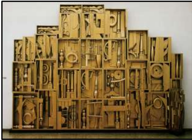
شكل رقم (٥) الفنانة لويز نيفلسون -الخامة صناديق واخشاب واشياء قديمة - ١٩٦٠ .

وخصوصا المعدنية هي من اكثر المواد تفضيلا للفنانين وذلك لكونها تتشكل بطرق لا حصر لها من خلال اللحام والتقطيع والسحب والطرق وايضا لسهولة الحصول عليها، ويعتبر روبرت روشنبيرغ ( اشهر فناني أمريكا الذين عملوا بتقنية (تداخل الوسائل) في الخمسينات والذي بدأ بالتحرك نحو ( الرسم الخليط ) وهو نسق إبداعي يخلط فيه السطح المصبوغ مع أشياء متنوعة مثبتة على السطح أحياناً ، كانت غايته من خلال ذلك تشتيت ذهن المشاهد وجعله أكثر انفتاحاً ووعياً بنفسه وبيئته ، وهكذا فقد استطاع (راوشنبيرغ) بتشكيلاته أن يجانس بين عالمين (الرسم والنحت ) بصيغة التجميع ثم ظهرت تجارب جديدة في الستينات والسبعينات تؤكد استمرار هذا التيار، وتعدد ممثليه ، وتعد نمودجا بارزا لتطور العمل الفني بعد الخمسينات ، حيث بدت الاعمال المؤلفة من أشياء مختلفة غنية بدلالاتها ومتنوعة بمضمونها وتقنياتها وايضا قد تناولت الفنانة الامريكية (لويز نيفلسون Nevelson (الجمع والتركيب بمفهوم جديد مستخدمة (الاشياء القديمة) في أعمال بيئية كبرى لها شكل الجدران الخشبية المبنية من علب ملئت بمختلف الأشياء المأخوذة من الأثاث ويتضح ذلك في شكل رقم [٥] حيث تتألف احدى هذه الاعمال المجمعة من عناصر خشبية أخذت من بيوت قديمة لتكوين أعمالاً تجميعية و قامت بتوظيف اشكال خشبية جاهزة الصنع مثل مساند الكراسي ومقابض ومواد مأخوذة من بيوت مهدمة في صناديق تم جمعها لتشكيل شبكة كبيرة او جدار وعادة تكون هذه المنحوتات والتكوينات عندها مطلية باللون الذهبي والأبيض والأسود .