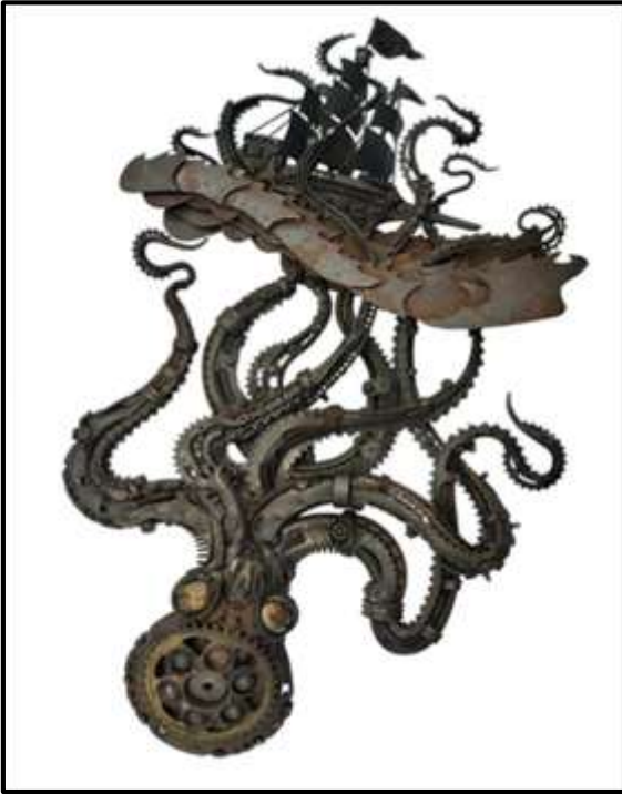
شكل رقم (١٠) الفنان آلان ويليامز- الخامة مصنوع من ٩٠٪ أجزاء دراجة نارية ، ١٠٪ قضيب ملولب وأشياء معدنية . المقاس ١٣٠ سم.

اليومية ومخلفاتها التي استنفدت صلاحياتها العملية، مثل "بوردا" الإلكترونية والأسلاك المعدنية، والبلاستيكية، إضافة إلى ما يخدم تكويناته الفنية من مخلفات "الخردة"، ليعيد صياغتها إنشائيا ببراعة فائقة أفضت إلى نتائج جمالية مختلفة عن السياق المألوف من حيث التكوين والتعبير. فالفنان يرى في الجنائز والتروس والسيور الحديدية المستهلكة، والمفاتيح القديمة والأقفال التالفة وقطع الأسلاك المهمل، وأدوات الورش وآلات الحرفيين التي لم تعد صالحة للعمل والخردة) تضم جماليات فنية رغم انتهاء وظيفتها الأصلية. نظرا لعدم فائدتها، حيث يقوم بتطويع القطع الحديدية من الخردة مع إضافة بعض المسامير والصواميل والبراغي باختلاف مقاساتها وأنواعها وإعادة تشكيلها من خلال القطع واللحام ببعضها البعض، ليكون الناتج في النهاية تشكيل مباشر من لوحات من النحت البارز متنوعة الأحجام والأشكال، يستقي أفكارها من البيئة المحيطة به ومعبرا بها عن فكرة. من خلال تقنية التشكيل المباشر بالخردة.