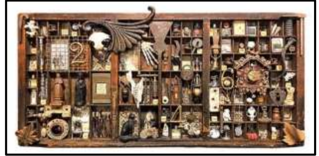
شكل رقم ( ٦ ) الفنان ديان هوفمان -الخامات زجاج وعظام وجلد وخشب -٢٠٢٠

وفي مطلع القرن الحادي والعشرين هناك العديد من الفنانين المعاصرين الذين استخدموا التجميع والخامات المختلفة ودمجها في اعمال النحت البارز ومن هذه التجارب الفنية الفنان شكل رقم [ ٦ ] للفنان (ديان هوفمان Diane Hoffman -)