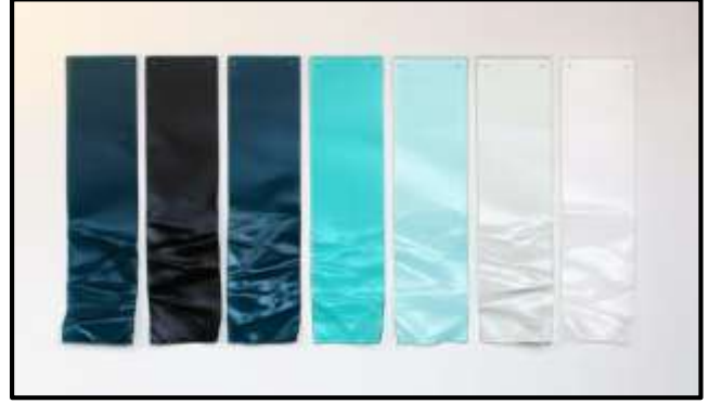
شكل رقم (٢) الفنانة ليزا كاهيل - الخامة الزجاج المشكل بالفرن ، الفولاذ المقاوم للصدأ.

مع متطلبات المجتمع وروح العصر ، ومن ثم تظهر بأسلوب فني جديد .