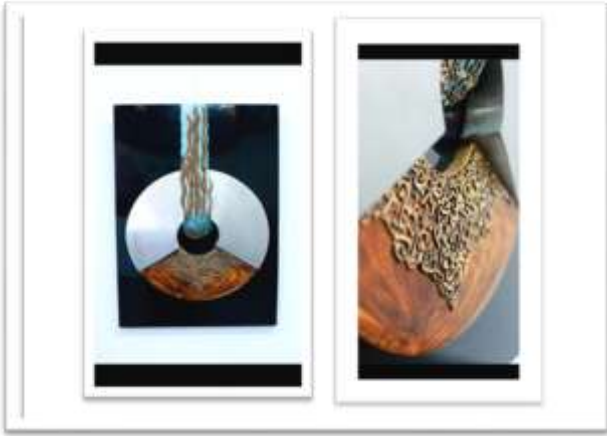
شكل رقم ١١ للفنان جمال صدقي -خشب - استنسل ستيل - ايبوكسي - ٢٠١٩ - مصر .

تشتمل عليه السمة الإبداعية ضمنا، والأصالة تعنى الاستعداد لإنتاج أفكار غير مألوفاً وليست اعتيادية، واستخدام الفنان اشكالا غير مطروقه للتعبير وكذلك للمادة الوسيطة، ولكن في نفس الوقت ان يكون مناسباً بالهدف او الوظيفة التي سيؤديها العمل المبتكر، كما يتضح من الشكل رقم [١١] عمل للفنان جمال صدقي تظهر فيها جماليات التشكيل المباشر بالخامات المتعددة من الاستنسل ستيل وخشب و ايبوكسي .