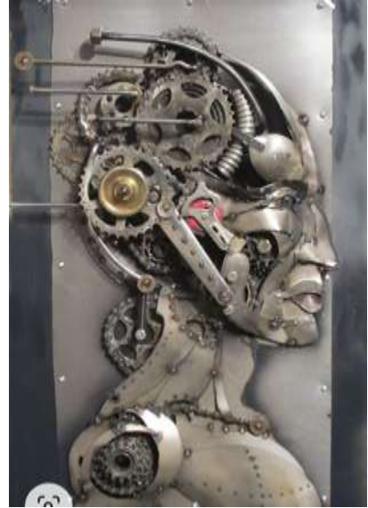
شكل رقم ٨- الفنان جويل سوليفان- الرجل المعدني- أجزاء من الخردة - كندا.

وهي التي تتصل بتغيير الشخص لوجهته الذهنية لمواجهة مستلزمات جديدة تفرضها المشكلات المتغيرة مما يتطلب قدرة على إعادة بناء المشكلات وحلها " فهي عكس التصلب في درجه من السهولة تعكسها الشخصية المبدعة عندما يكون باستطاعتها تغيير وجهه عقليه معينه ويميل الفنان الذي يتمتع بخاصية المرونة الى إعادة بناء عمله الفني بسرعة في المواقف الجديدة وذلك في سياق العمل اثناء حل مشكله فنيه حيث يتغير الموقف باستمرار" (محسن عطية - ١٩٩٥) كما يتضح من الشكل رقم [ ٨ ] للفنان جويل سوليفان ( JOEL SULLIVAN ) وهو من الخردة غير وجهته الذهنية لحل المشكلات التي فرضتها الخامه الجديدة وانتقاء ما يصلح للتعبير عن موضوع العمل والتأكيد على عملية المرونة في انتقاء الأجزاء التي تصلح للعمل والتي توجهه الى حل المشكلات البنائية للعمل .