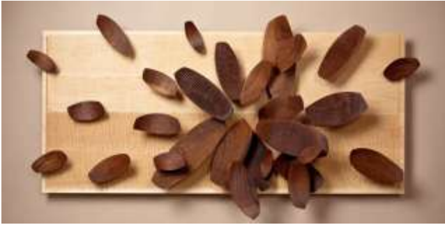
شكل رقم ٩- الفنان ديان بلوفر - خشب القيقب والجوز -المقاس ٢٦ x ٥٢ ٨ x بوصة - ٢٠١٠ - الولايات المتحدة.

يوضح عملية المرونة التلقائية، أثناء إنتاجه للعمل قد مر بعملية تقلبات مزاجية اعطى حرية في تغيير لوجهة الذهنية، فالفنان أحيانا يقوم بتوزيع أشكاله وحجومه بطريقة ما في وقت ما واذا عاد للعمل مرة أخرى فانه يغير توزيع تلك الاشكال بطريقة أخرى حسب استعداده المزاجي اثناء العملية الإبداعية والتي تعرف المرونة التلقائية وقد اطلق الفنان على العمل عنوان ( لحظات عابرة -FLEETING MOMENT) (في حين نتيج المرونة التكيفية للشخص تغيير الزوايا الذهنية التي ينظر منها الى حل مشكله محدودة تحديدا دقيقا، تكون المرونة التلقائية مسؤولة عن انتاج عدة أفكار في موقف غير مقيد بهذه الدرجة، بحيث يتجه وجهات جديدة بسرعة وبسهولة لسبب او لغير ما سبب واضح. ويجب الا يختلط علينا الامر بين عامل المرونة التلقائية، هذا وبين عامل الطلاقة الفكرية، فيما يبرز عامل المرونة اهمية تغيير اتجاه ومسار افكارنا، يبرز عامل الطلاقة اهمية كثرة الأفكار، (مصطفى سويف - ١٩٨٣)، فمن مظاهر المرونة عند الفنان الابداع في أكثر من إطار او شكل وايضا في التنوع والتلقائية، وكذلك الاستخدام المختلف والغير التقليدي للأشياء والأفكار العادية او الميل الى تحديد التفاصيل التي تساهم في تنميه فكرة او شكل معين او اكمال عمل ما.