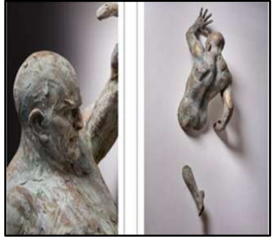
شكل رقم ١ - الفنان ماثيو بوليسي - برونز - ١١٨ × ٣٥ × ٢٦٢ سم - ٢٠١٩ ميلان .

الجدار واجزاء اخرى خارجه في إيقاع حركي بديع ، فجعل العين تستكمل الجزء الناقص من التمثال ليصنع حوارا تشكليا بين التمثال والجدار المنحوت عليه العمل .