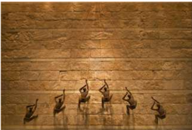
شكل رقم ٧- للفنان بيل سترونغ -خامة البرونز- المتسلقون في فندق حياة ريجنسي بمدينة Centennial ,Coiorado الولايات المتحدة الأمريكية.