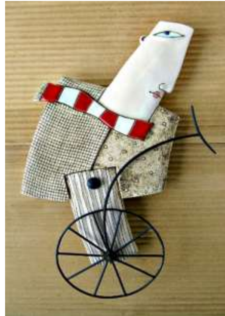
شكل رقم ١٠ - ماكيونسكي - المقاس: ٣١,٥ / ١٨,٨ سم - سيراميك ومعدن - ٢٠٢١ - بلغاريا .

في النشاط الإبداعي، ومن مظاهر المرونة أيضا القدرة على التأليف والتحليل وتعنى الميل الى تفهيم مركبات قائمه بالفعل وتحويلها الى وحدات ايسط، ويمكن إعادة تنظيمها بطريقه جديدة وتسمح المرونة للشخص ان يظل عقله متفحاحا، وبفضلها يقوم بإجراء التغييرات والتعديلات في اللحظة الأخيرة، ويظهر عندما يكون قدرة الفنان على معالجه قدر أكبر من الوسائط او فكرة مع متطلبات خامه وسيطه جديدة وأيضا مختلفة "ويتمكن الفنان المحترف الذي يتمتع بخاصيه المرونة من الاستفادة مما تقدمه المصادفات الناشئة عن المادة الوسيطة من مميزات، وبدون هذه القابلية المرنة على التغيير من حاله التركيز الثابت على طريقه واحده من اجل التوصل الى حل، فسوف نشعرنا النتائج بحاله من الإحباط بل وستفقد باستمرار العديد من الحلول الأفضل، وكذلك تشير امكانيه التحرك من طريقه العمل الى أخرى بسهولة الى توفر عنصر الطلاقة. وهنا يستطيع الفنان التحول من مستوى المعالجات العفوية الى الأخرى المقصودة، والمتأنية، والأكثر عقلانية، تبعا لمتطلبات المشكلة التي أثارها للحل، وأيضا الشخص الذي يستطيع التعبير من خلال تنوع الأدوات والحيل، عن نفس الفكرة، بمدى واسع من الحلول الفنية، هو قطعاً يتمتع بمرونة ( محسن عطية - ١٩٩٥ ) .