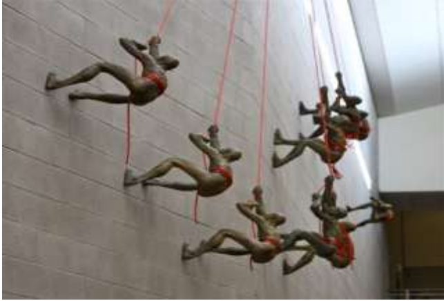
شكل رقم ٦- الفنان بيل سترونغ-خامة البرونز- المتسلقون في مدرسة Centennial ,Coiorado بمدينة Regis Jesuit High School الولايات المتحدة .

وربما يرجع التنوع في الإنتاج الفعلي الى الاختلاف فالشخصية، والأسلوب ، وطرق المعالجات ، والمواد الخام المستخدمة، (محسن عطيه -١٩٩٥) كما يتضح من الشكل رقم [٦] و شكل رقم [٧] للفنان "بيل سترونغ" (BILL STARKE) حيث استخدم الفنان شخصياته المتسلقة للتعبير عن موضوعات مختلفة وهذا العمل مكون من تسعة شخصيات باسم " التسلق الى القمة " ونفذ في مدرسه " Regis Jesuit High School " ليكون مصدر الهام للطلاب واستعارة بصرية لتذكير دراستهم وانجازهم وهذا يعطى نتيجة إيجابية لتحقيق الأهداف الناتجة من العمل الجاد وأيضا استخدمهم مفهوم المتسلقين – حيث يجتمع الناس في مؤتمر للعمل نحو هدف مشترك. في المتسلقون في فندق حياة ريجنسي .