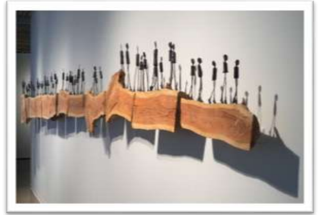
شكل رقم ٣- الفنان هولبي ويلسون- برونز - خشب - أمريكا

هي الرغبة العميقة المسيطرة لكي يكون مبدعا متفردا ومجددا واصيلا وهو الذي (عبر عنه كارل روجرز " يبدو لي ان الدافع الأساسي للأبداع هو نفس الدافع الذي نكتشفه بعمق على انه القوة التي تدفع الى الشفاء في جلسات العلاج النفسي (اي نزعه الفنان نفسه الى تحقيق ذاته، وان يحقق امكانياته و التوق الى الانتشار والامتداد والتطور والنضوج والميل الى التنشيط والتعبير عن كل قدراته والى مدى يكون هذا النشاط معزز له) (شاكر عبد الحميد -1987)