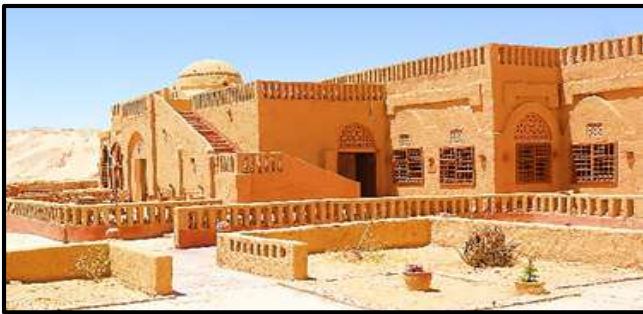
شكل (١٣) واجهة ومدخل الفندق (الباحثة، ٢٠٢١) .

تحتوي واحة الداخلة علي أكبر عدد من الفنادق في محافظة الوادي الجديد ويبلغ عددهم ١٣ فندق (يوسف، ٢٠١١، صفحة ٢٣) وتسعي جميع هذه الفنادق إلى تحقيق مبادئ الاستدامة في كافة الأنشطة السياحية وتم تناول أحد هذه الفنادق للتركيز علي جوانب الاستدامة ، فندق ديزرت لودج ويقع في قرية القصر الإسلامية في واحة الداخلة، تم إفتتاحه عام ٢٠٠٣ وهو علي هيئة قصر إسلامي مبني علي تلة عالية (الدين، ٢٠١٣، صفحة ١٠) علي غرار قصر أثري من العصر الأيوبي وهو مكون من ٣٢ غرفة كبيرة، يبلغ مساحة كل غرفة أكثر من ٣٥ م ٢ ، يتسم ببساطة الطراز المحلي ، تم تصنيفه كأفضل فندق بيئي على مستوى العالم من ضمن ٢١ منشأة سياحية دولية في عام ٢٠٠٤، ثم حصد الفندق بعدها خمس جوائز عالمية مختلفة علي مدار أعوام عدة لتطبيقه لجوانب الاستدامة أهمها عام ٢٠١١ من منظمة ألمانية للسياحة (lodge، ٢٠١١) .