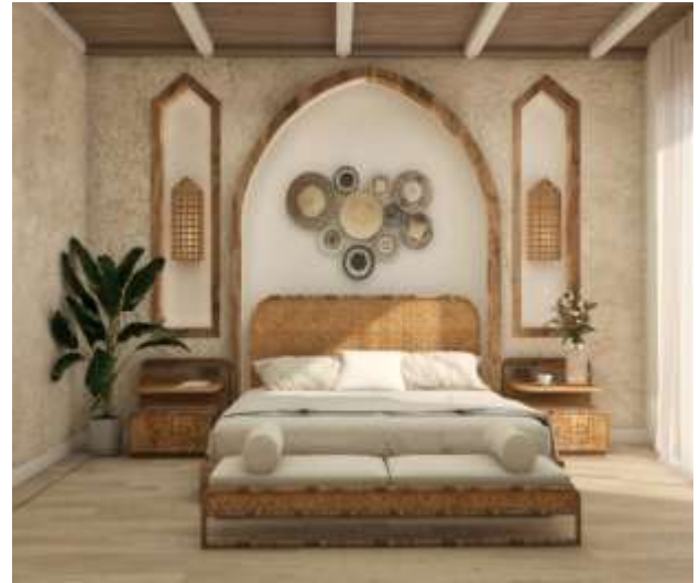
شكل (١٧) التصميم المقترح للغرفة الفندقية بعد تعديل بعض عناصر التصميم الداخلي (الباحثة، ٢٠٢١)

التصميم الداخلي الحالي للغرفة غير مرتبط بالطراز التاريخي للقريّة في الألوان والزخارف على الجدران. وتم الاعتماد على ألوان عدة أغلبها درجات الأخضر والأزرق مما لا يرتبط بالجو العام الموجود بالقريّة ولا يحقق المبدأ الرابع من مبادئ السياحة المستدامة. تم توظيف الحرف اليدوية كصناعة السعف والجريد والخزف. تم الاستعانة بالخط بالخط العربي علي الحوائط كما في المباني الأثرية بالقريّة. ولكن بشكل تقليدي وغير أساسي مما يؤكد علي غياب دور المصمم الداخلي.