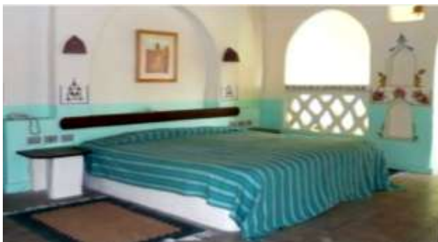
شكل (١٦) التصميم الحالي للغرفة الفندقية

من الملاحظ اهتمام الفندق بتطبيق كافة مبادئ السياحة المستدامة. إلا أن التصميم الداخلي للغرف النزلاء لم يستغل فرصة تنوع الصناعات اليدوية المنتشرة في الواحة بشكل أفضل؛ إذ يمكن تطبيق عدد من التعديلات في بعض عناصر التصميم الداخلي التي من شأنها ادراج الخامات المحلية بطريقة تثري التصميم الداخلي وتتوافق مع هوية قرية القصر، وتؤكد على الطراز المعماري الأثري للقرية. فتلك التعديلات تجعل من تصميم الغرفة تصميم مرتبط بثقافة وتراث مجتمع القرية، وتزيد من فرص قدوم الزائر للاستمتاع والراحة بالمكان. بالإضافة إلي توفير فرص عمل بشكل أفضل لكافة الحرف المنتشرة بالقرية.