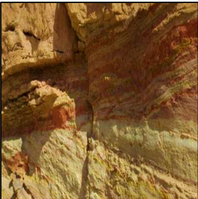
شكل (٣) تدرج الألوان في الصخور المنتشرة بالداخلة (الباحثة، ٢٠٢١)

تتميز الواحة بمقومات طبيعية وخصائص جغرافية وجيولوجية متعددة، كما نرى شكل (٣) ألوان الصخور تتدرج من الأصفر والأبيض إلى البرتقالي والأحمر، ويحيط بها عدد من المحميات الطبيعية مثل: محمية الصحراء البيضاء التي تضم عدد من الكثبان الرملية، والتكوينات الجيولوجية لصخور الأحجار الجيرية ناصعة النياض وما تحتويه من حفریات مميزة يرجع عمرها إلى أكثر من ٦٥ مليون سنة، ومحمية الجلف الكبير التي تتميز بوجود العديد من الكائنات الحية النباتية والحيوانية وينتشر بالواحة عدد أنواع عدة من النخيل كما بشكل (٤).