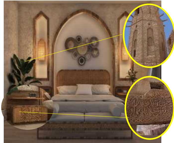
شكل (١٨) التصميم المقترح وتفاصيل الكمود بجوار السرير وأجزاء من مصادر الإستلهام في المباني الأثرية بالقريّة كالمأذنة وأعتاب الأبواب الخشبية. (الباحثة، ٢٠٢١)

٣- تصميم السقف تم باستخدام جذوع النخل، وتم إخفاء الإضاءة وجعلها على الحوائط أو متحركة لتتوافق مع معايير التصميم الداخلي للغرفة الفندقية وتم الاستغناء عن مروحة السقف والإعتماد على داكت تهوية مرتبطة بمراوح مركزية وشفاطات مع الاحتفاظ بالفتحات العلوية الموجودة بالغرفة وكذلك الاحتفاظ بالمشربية الموجودة علي الفتحات لتتقية الهواء للتوافق مع المبدأ الثاني والثالث من مبادئ السياحة المستدامة.