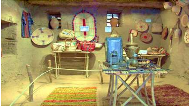
شكل (١٢) جزء من متحف الإثنوغراف يوضح أعمال السعف والجريد وبعض الأواني النحاسية القديمة والكليم في الأرضية (الباحثة، ٢٠٢١) . ٢-الدراسة الميدانية :

بالواحة وهو مكون من دورين ويستخدم لعرض الأعمال الفنية .