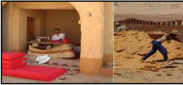
شكل (١٥) العمال أثناء إنشاء الفندق (lodge, 2011) .

٥- الإنخراط مع المجتمع المحلي: يقوم الفندق بانتظام بتنظيف الجزء القديم من القرية جنباً إلى جنب مع أطفال المدارس المحلية مما يساعد علي الحفاظ علي الإيكولوجي للبيئة .