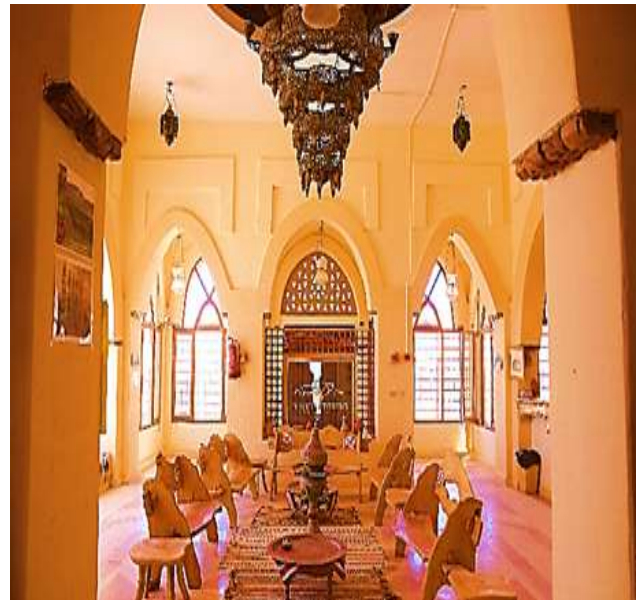
شكل (١٤) شكل منطقة الاستقبال بالفندق.

٣- توفير مصدر للإحتياجات الأولية من الغذاء : توجد مزرعة بجوار الفندق تهتم بتوفير مصادر غذاء عضوية كما يتم صيد السمك من البحيرة الموجودة بواحة الداخلة كما توجد حظيرة لتربية دواجن . (Cornelia Redekerk, Hazem Fouad, 2015, pp. 11,12)