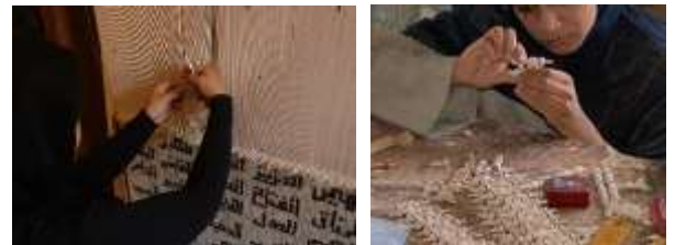
شكل (١٠-١١) فتيات يقمن بصناعة أجزاء الأرابيسك ، صناعة الكليم والصوف بقرية بشندي

٤- صناعة السعف وجريد النخل وصناعة الكليم والسجاد: في "قرية بشندي وهي قرية صغيرة مبانيها من عصر الفراغنة ومبنية بالطوب الأخضر وتشتهر بصناعة البطانية الصوف والسجاد" (يوسف، ٢٠١١، صفحة ٢٣) .