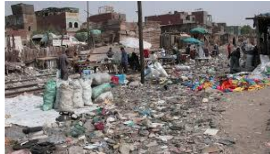
شكل (1، 2) منظران لأكوام القمامة باحدى الشوارع المصرية ذات الطابع العشوائي

في ظل العشوائيات قد تتعد الطرز و تتباين و تختلط و قد لا تظهر أى من هذه الطرز بشكل محدد و واضح و تتجلى في هذا المجتمع حالة من الارتباك الذى يضر بالقدرة الابداعية و بالتالى يكون على الاعمال النحتية التي قد يبدعها فنان يعيش أو يتأثر بهذه العشوائيات .