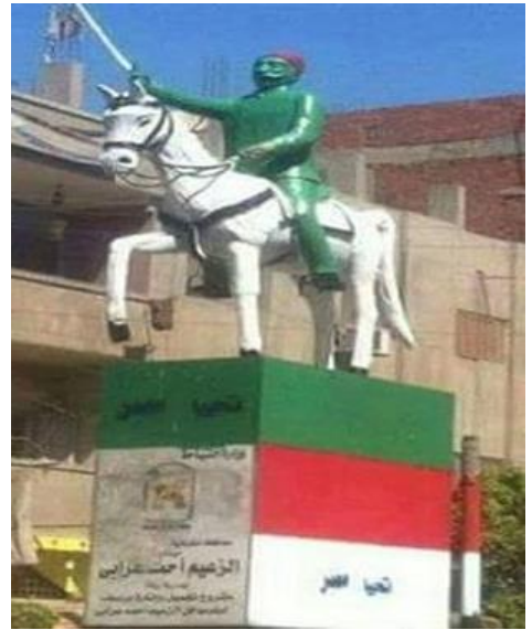
شكل (5) احدى التماثيل المشوهة

نماذج من الأعمال الفنية المشوهة توضح العشوائية الفنية